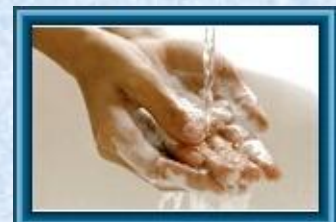
ФЛОРА М-1 ДЕЗ.

Высокопенное щелочное средство на основе ЧАС (пенная санобработка)